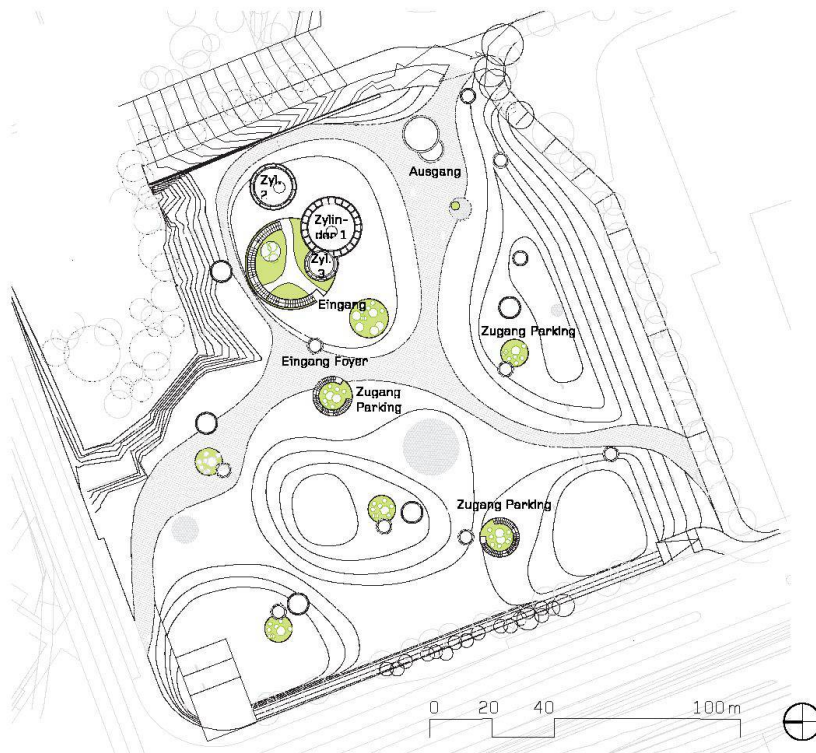
01 Museo Interactivo de la Historia in Lugo. Situation der Museumsanlage (Pläne: Nieto Sobejano Arquitectos)

Die Auseinandersetzung der Architekten mit den Gegebenheiten des Ortes, aber auch ihr Interesse für die Tektonik lassen sich bei all