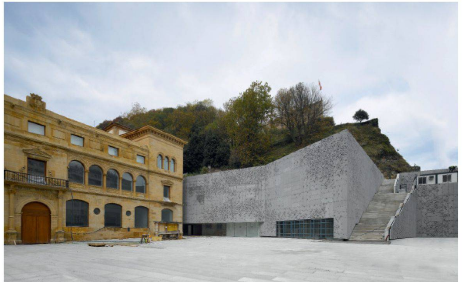
04 Erweiterung des Museo San Telmo im baskischen San Sebastián. Im Hintergrund der Berg Urgull

Berg Urgull einbezieht. Der kontextuelle Bezug des Projekts ist also nicht nur dem Stadtraum, sondern auch der Landschaft geschuldet.