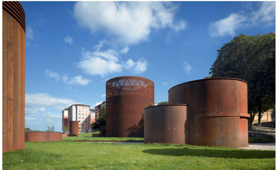
02 Türme und Rampen im Museo Interactivo de la Historia de Lugo