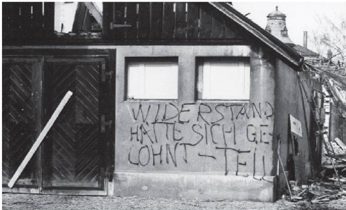
01 Sprayerei anlässlich des «Tell»-Abbruchs 1981 in Langenthal, Gilles Aubry und Yves Mettler