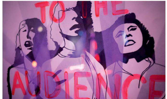
02 Fabian Chiquet, Power To The Audience, 2009 (Zeichnung: Fabian Chiquet)

Zwei neue Ausstellungen im Kunsthaus Langenthal beschäftigen sich mit dunkler Materie: «Black Move» des Künstlerduos Aubry/Mettler mit dem Teer der Firma Ammann. Und «Dancing High Low» von Fabian Chiquet mit lichtscheuen Dancefloors.