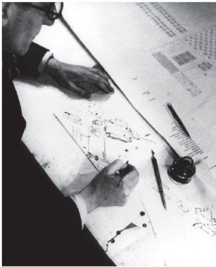
01 Le Corbusier (1887 – 1965) beim Skizzieren, 1935