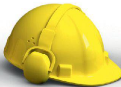
Innenausbau & Akustik