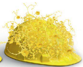
Nachhaltigkeit & Innovation

Auf die Erstellung hochkomplexer Klinker- und Sichtsteinfassaden haben wir unser Fundament gebaut. Dass wir visionär denken und entsprechend planen und realisieren, beweisen wir täglich in sämtlichen Bereichen unserer Geschäftsfelder. Wir schaffen Mehrwert, mit System am Bau: www.keller-ziegeleien.ch