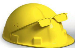
Planung & Ausführung