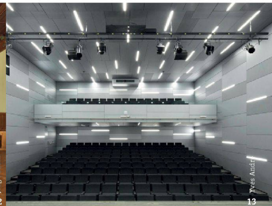
Yves Andri 13