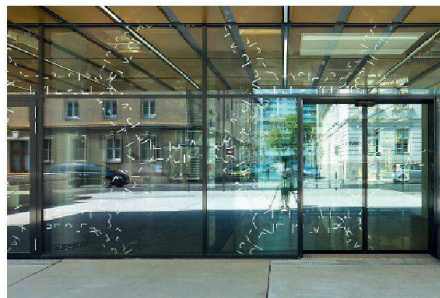
03 Abstrahierte Bewohnerzitate als Durchlaufschutz im Geriatriezentrum Liesing

Der Andachtsraum selbst liegt als holzverkleidete Schatulle unter dem aufgeständerten Gartentrakt. Innen mit Holzboden und gestockten Sichtbetonwänden ausgestattet, strahlt er eine erdige Ruhe aus. Die Künstlerin Svenja Deininger verlieh ihm mit einem strahlend weissen Faltojekt, einer Textilarbeit und einem schlanken Holzkörper Akzente, die seine sakrale Ausstrahlung unterstützen.