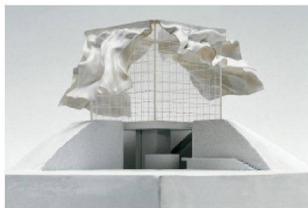
02 «Haus mit Vorhängen», nicht realisiert, Modell 1972. Architektur: Raimund Abraham. Abraham entwarf archetypische Häuser, mit denen er der kommerziell geprägten Architektur seiner US-amerikanischen Zeitgenossen eine neue erzählerische Tiefe entgegenhielt

Der Kurator Oliver Elser präsentiert Architekturmodelle nicht in Bezug auf Architektur, sondern untersucht sie als eigene Objekte. Besonders pointiert zeigt sich unter dem Zwang zur Reduktion, wie mit Architektur die Welt gedeutet wird. Modelle werden präsentiert als Mittel des Forschens danach, was Architektur sein kann. Die poetischen Wachstumsmodelle von Merete Mattern – Architektin und Mitbegründerin der deutschen Partei «Die Grünen» – aus den 1980er-Jahren bereicherten das Formenrepertoire, das «Haus mit Vorhängen» (Abb. 2) des österreichisch-US-amerikanischen Architekten Raimund Abraham machte vorübergehend vergessene Potenziale der erzählerischen Tiefe von Architektur wieder diskursfähig. Grosse Modelle der Stadtutopien aus den 1960er- und 1970er-Jahren manifestierten den Glauben, die Kom-