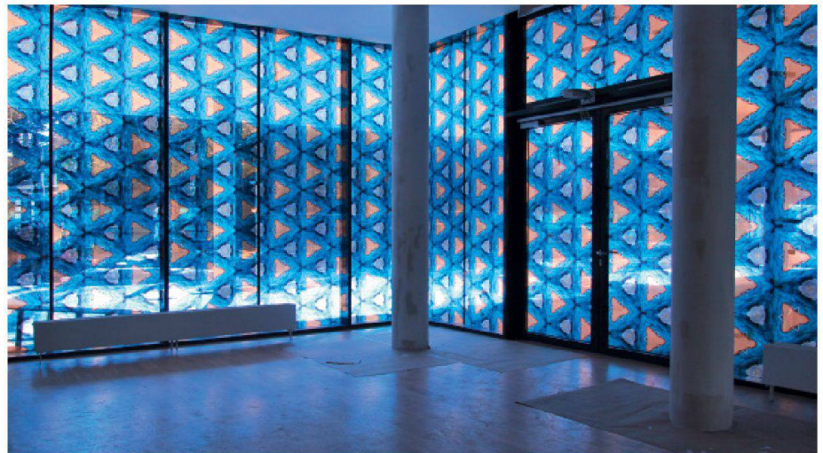
01 Im Geriatriezentrum Liesing übertrugen die Künstler ein Detail aus einer Häkelarbeit der Bewohner auf eine Glasplatte, wo es sich zu einem geometrischen Muster fügt

das Buchstabengewirr zur Metapher für das Innenleben der Menschen. An einer Stelle fügt es sich wieder zu einem – nur vom Rollstuhl aus – erkennbaren Satz. Weitere Bewohnerzitate, die im Zuge der Künstlerbesuche gefallen sind, finden sich als Durchlaufschutz an Glasflächen in den Erschließungsspangen. Im Vorraum des Andachtsraumes schafften die Künstler mit einem im kaleidoskopartig aufgesplitteten Detail einer Häkelarbeit aus der Ergotherapiegruppe, das sich über die ganze Glasfläche erstreckt, eine ruhige Atmosphäre von heiterer Grundstimmung.