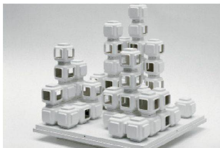
01 Kapselhäuser, Solingen-Caspersbroich, nicht realisiert, Modell 1969. Architektur: Wolfgang Döring, Düsseldorf. Das modulare Bausystem aus gleichartigen und vorgefertigten Wohnkapseln ist im Präsentationsmodell in reiner Form umgesetzt

Annähernd 1000 Modelle sind zu sehen, etwa ein Drittel davon stammt aus dem hauseigenen Archiv, manche werden das erste Mal präsentiert, wurden auf Dachböden oder in Speditionen aufgespürt. Dabei geht es um das Architekturmodell des 20. und 21. Jahrhunderts, wobei die meisten Exponate aus der Nachkriegszeit stammen und bis zu Arbeiten jüngerer Architekten der Gegenwart reichen. Damit wird deutlich, dass das Modell als Hilfsmittel des Entwerfens und der Präsentation des Entwurfs nicht ausgedient hat. Eingeleitet mit einer «Vorgeschichte» aus Fotos in Originalgröße von exemplarischen Modellen, die vor dem 20. Jahrhundert entstanden