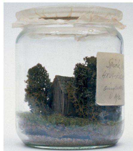
03 Stück Natur eingeweckt, nicht realisiert, Modell 1973. Architektur: Haus-Rucker-Co, Wien. Mit dem Objekt unternahm die Architektengruppe den Versuch, sich über Verkäufe auf einer Kunstmesse zu finanzieren

plexität der Stadt beherrschen zu können. Die Exponate zeigen zugespitzt, wie das Verständnis der Entwurfsaufgabe darauf Einfluss nimmt, welchen Parameter Bedeutung eingeräumt wird. Die Hängemodelle von Frei Otto dienten der Konstruktionsoptimierung und Formfindung, das Modell für die französische «Ville nouvelle» Melun-Sénart von Rem Koolhaas/OMA war eine suggestive Darstellung des Raumverständnisses, das dem Entwurf zugrunde lag und diesen bestätigte: dass Planung präzise Rahmenbedingungen setzen müsse, aber auch Entscheidungen abgeben könne, ohne an Qualität einzubüssen.