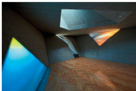
02 Andachtsraum, Pflegewohnhaus Simmering: Medienfenster ergänzen die geometrische Höhle

«Wisst ihr, ich habe Sternenstaub auf mich rieseln lassen.» Aus den Buchstaben dieses Zitats eines Heimbewohners setzt sich die am Muster eines Kaleidoskops orientierte Gestaltung der Verglasung des Eingangsbereiches zusammen. Das Kaleidoskop wird hier zum Sinnbild für den Eintritt in eine andere Welt,