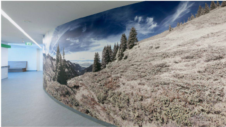
04 Die «Landschafts-Inseln» im Pflegewohnhaus Meidling sind auch Projektionsflächen, die Bewohner können Landschaften aus der Erinnerung damit verbinden

schaftspanoramen, die über die im Kern des Gebäudes situierten Raumgruppen gespannt sind. Die in Österreich aufgenomme-