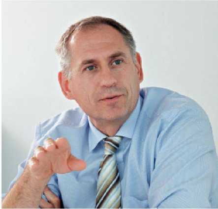
04 Hans-Peter Wessels, Regierungsrat des Kantons Basel-Stadt und Vorsteher des Bau- und Verkehrsdepartements, seit 2011 Präsident des Gotthardkomitees

Platz – ausser man streicht den Personenverkehr, oder verlängert dessen Reisezeiten. Grundsätzlich fällt mir in Bezug auf die ganze Neat-Diskussion in der Politik der Reflex der Schweiz als «Land der Ingenieure» auf: Ist man mit einem Problem konfrontiert, baut man am liebsten einen Tunnel und meint, damit sehr viel für die Welt getan zu haben. Dieses Denken greift zu kurz. Besser wäre: Wir haben mit Tunnels wichtige Infrastrukturen gebaut. Um diese optimal zu nutzen, braucht es bei jedem Tunnel auch vor- und nachgelagert zusätzliche Investitionen.