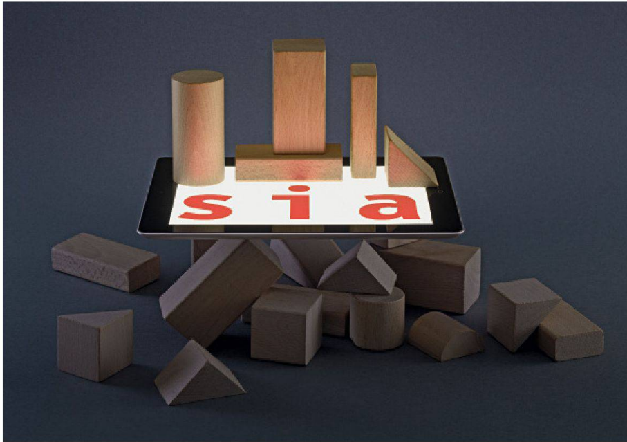
01 Breit abgestützte Basis für das Planen und Bauen: SIA-Vertragsformulare neu als kostenlose Downloads erhältlich ( www.sia.ch/contract )

Der SIA nimmt sein 175-Jahr-Jubiläum zum Anlass, seine Vertragsformulare neu als kostenlose Downloads zur Verfügung zu stellen. Ziel ist es, dem Original zu einer noch breiteren Anwendung zu verhelfen und damit einen klar geregelten und fairen Umgang aller am Planungs- und Bauprozess Beteiligten zu fördern.