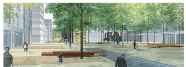
10 Place couverte: vielseitig nutzbare Fläche unter Blätterdach.