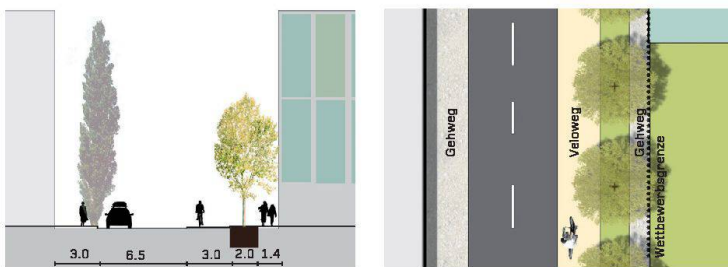
05–06 Avenue de Malley: West-Ost-Achse, Schnitt und Grundriss.