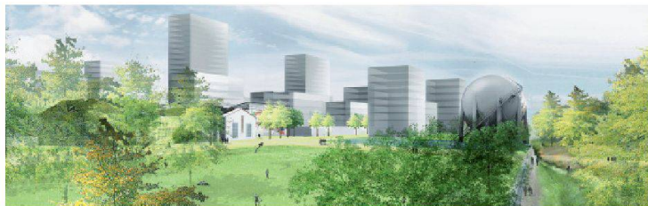
04 Park beim Gasometer mit Blick Richtung Bahnhof.