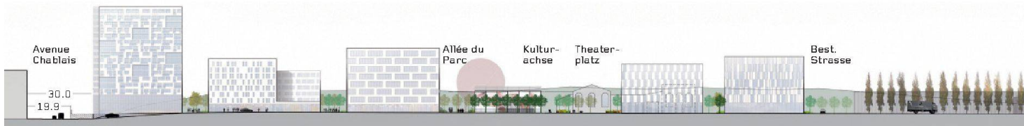
01–02 «Les Coulisses» (SAS Jalbert & Tardivon): Schnitte Ost–West und Nord–Süd, Mst. 1:2300. (Pläne und Visualisierungen: Projektverfasser)

Evolutionärer Kulissenwechsel: Das Team um die Landschaftsarchitekten In Situ Jalbert & Tardivon aus Lyon gewinnt den Wettbewerb für die städtebauliche Entwicklung der öffentlichen Räume an der S-Bahn-Station Prilly-Malley zu einer neuen Mitte für Lausanne West.