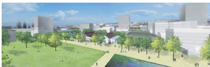
07 Kulturachse: Nord-Süd-Verbindung von Plätzen, Park und Nachbarquartieren.