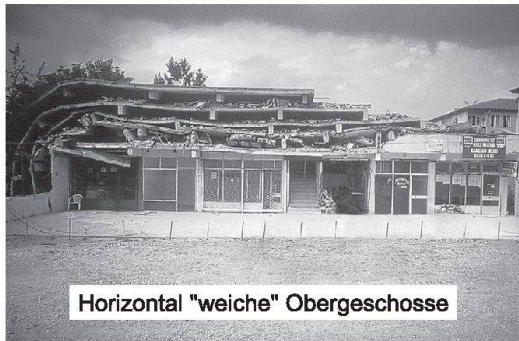
Horizontal "weiche" Obergeschosse