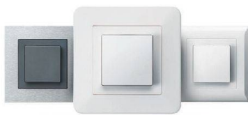
kallysto.art kallysto.trend kallysto.line