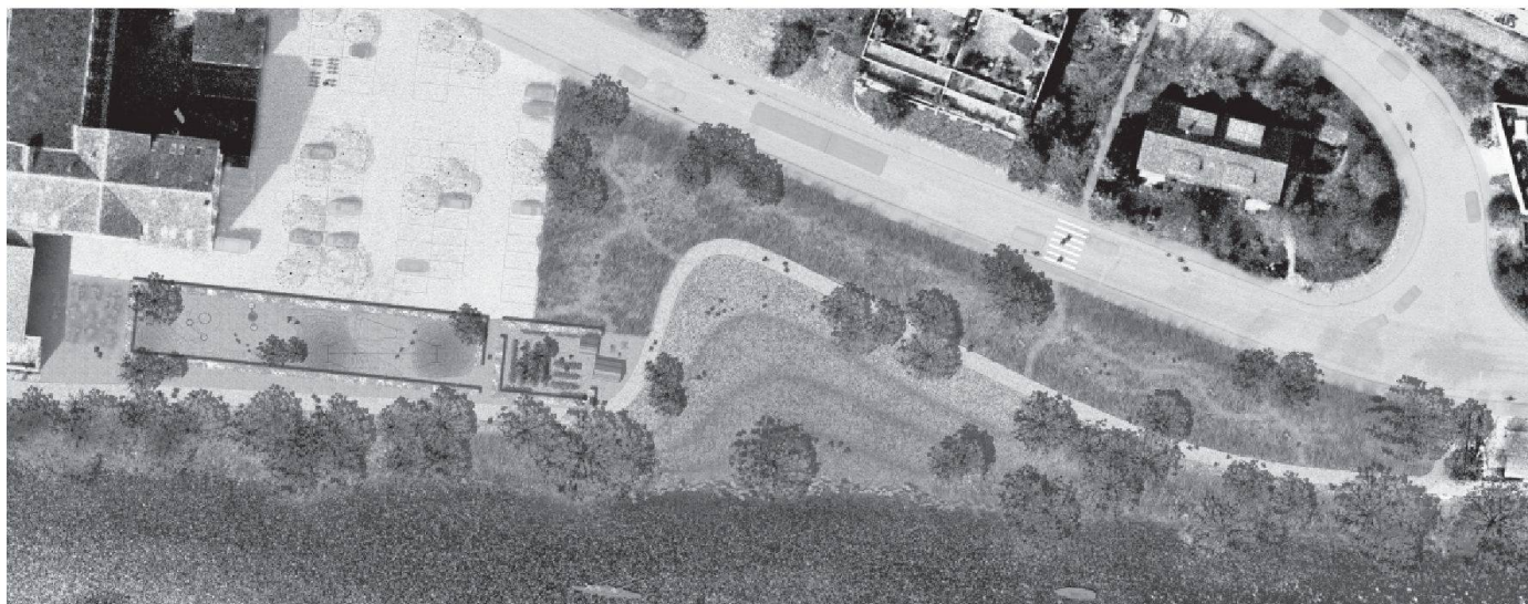
06 «Wendung». (Plan: Group Schönbühlstrasse)