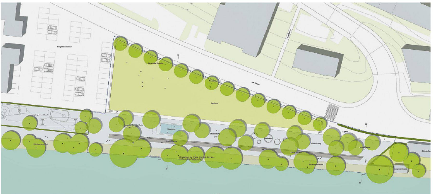
05 «Canale Piccolo». (Plan: Lars Uellendahl/Vedrana Zalac)