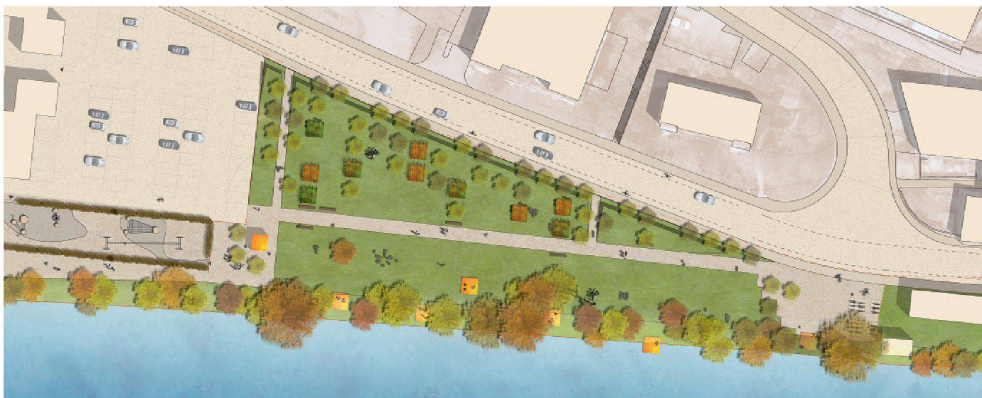
07 «Das Viereck». (Plan: Elodie Rué, Zürich)

ist das Projekt seines Herzstücks beraubt. Die «Gartenzimmer» des Siegerprojekts hingegen können im Lauf der Zeit veränderten Nutzerwünschen angepasst werden.