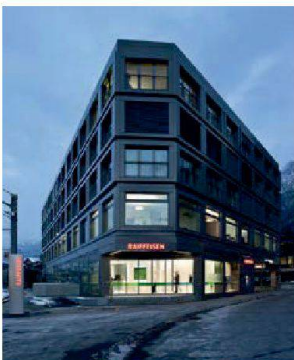
Modern und gediegen: Raiffeisenbank, Chur

Die FeuerschutzTeam AG und Ihre Partner bieten schweizweit Spezialtür-Systeme als Komplettlösung an – mit Beratung, Planung, Massfertigung und fachgerechter Montage aus einer Hand. Türelemente, Trennwandsysteme, Pendel-/Schiebetüren und Schachtwände sind in den Ausführungen Brand-, Rauch-, Schall- und Einbruchschutz sowie beschusshemmend verfügbar.