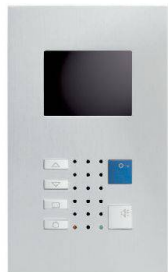
VTC40 / Alu

Video-Innensprechstellen aus edlem Metall – bilden einen Blickfang im gehobenen Innenausbau. Als Klein- ausführung im Schalterformat (Gr. 1+1) oder mit grösserem Farb- display für erweiterte Videoüberwachung. Die Frontplatten aus veredeltem Aluminium bestechen durch das klare Design und bleiben zeitlos wertbeständig. Die neueste Technik ermöglicht überall einen schlanken Einbau.