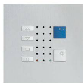
TC40 / Alu