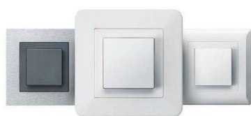
kallysto.art kallysto.trend kallysto.line