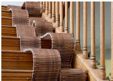
01 Führt die Besucher zur Ausstellung: «Der Läufer» von Annette Douglas aus mit Nussbaum furniertem Birkenesperrholz.

Die Ausstellung «Wood Loop» im Gewerbemuseum Winterthur befasst sich mit der Biegsamkeit von Holz. Ein Teil widmet sich dem Einschneiderverfahren «Dukta», der andere zeigt Techniken zur Produktion und Verarbeitung von Formholz. Exponate vermitteln das Potenzial des Materials.