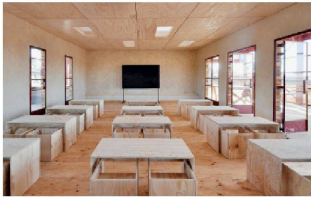
Natürlich belüftetes Schulzimmer.

TEC21: Mit Lehm zu arbeiten erscheint nachvollziehbar. Die Bauweise ist ohne grossen Aufwand für die Bevölkerung umsetzbar.