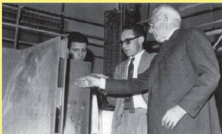
01 Pier Luigi Nervi (rechts) 1965 zusammen mit Ingenieuren des ISMES vor dem Modell der 1966–1971 in San Francisco gebauten St. Mary's Cathedral.

Katalog: Carlo Olmo, Cristina Chiorino (Hg.), Pier Luigi Nervi. Architecture as Challenge, Mailand 2010, ISBN 978-8-83661-756-2, CHF 43.–/Euro 35.– (auch auf Italienisch und Französisch erhältlich).