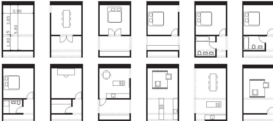
03 Variationen des Grundmoduls, Mst. 1:200.

kann die Bauherrschaft ihre Wohnung dann zusammenstellen.