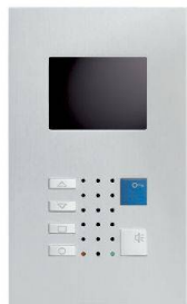
VTC40 / Alu

Video-Innensprechstellen aus edlem Metall – bilden einen Blickfang im gehobenen Innenausbau. Als Klein-ausführung im Schalterformat (Gr. 1+1) oder mit grösserem Farbdisplay für erweiterte Videoüberwachung. Die Frontplatten aus veredeltem Aluminium bestechen durch das klare Design und bleiben zeitlos wertbeständig. Die neueste Technik ermöglicht überall einen schlanken Einbau.