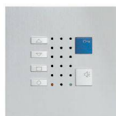
TC40 / Alu