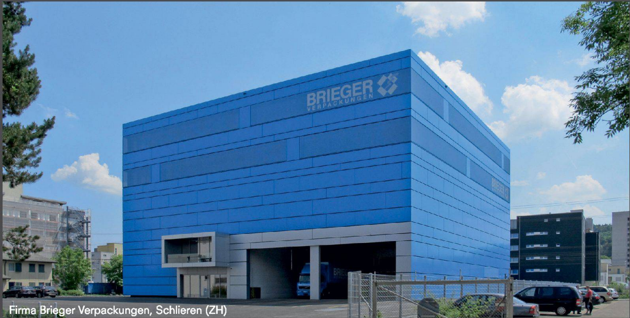
Firma Brieger Verpackungen, Schlieren (ZH)

Inspirierende Farbfülle und aussergewöhnliche Oberflächenvielfalt