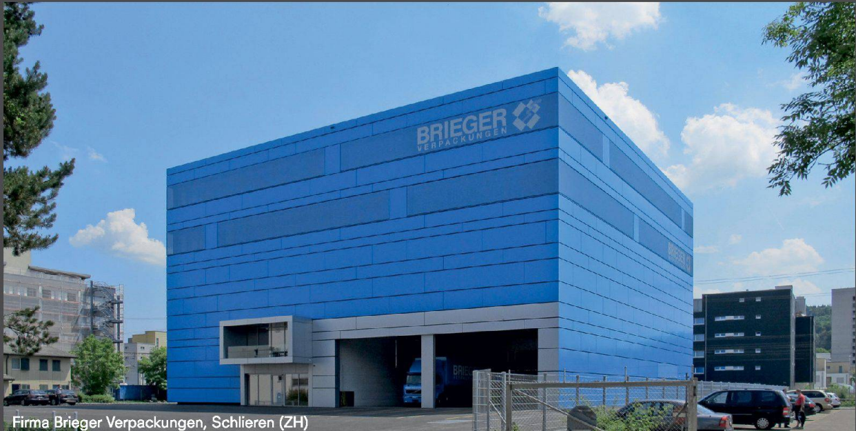
Firma Brieger Verpackungen, Schlieren (ZH)

Inspirierende Farbfülle und aussergewöhnliche Oberflächenvielfalt