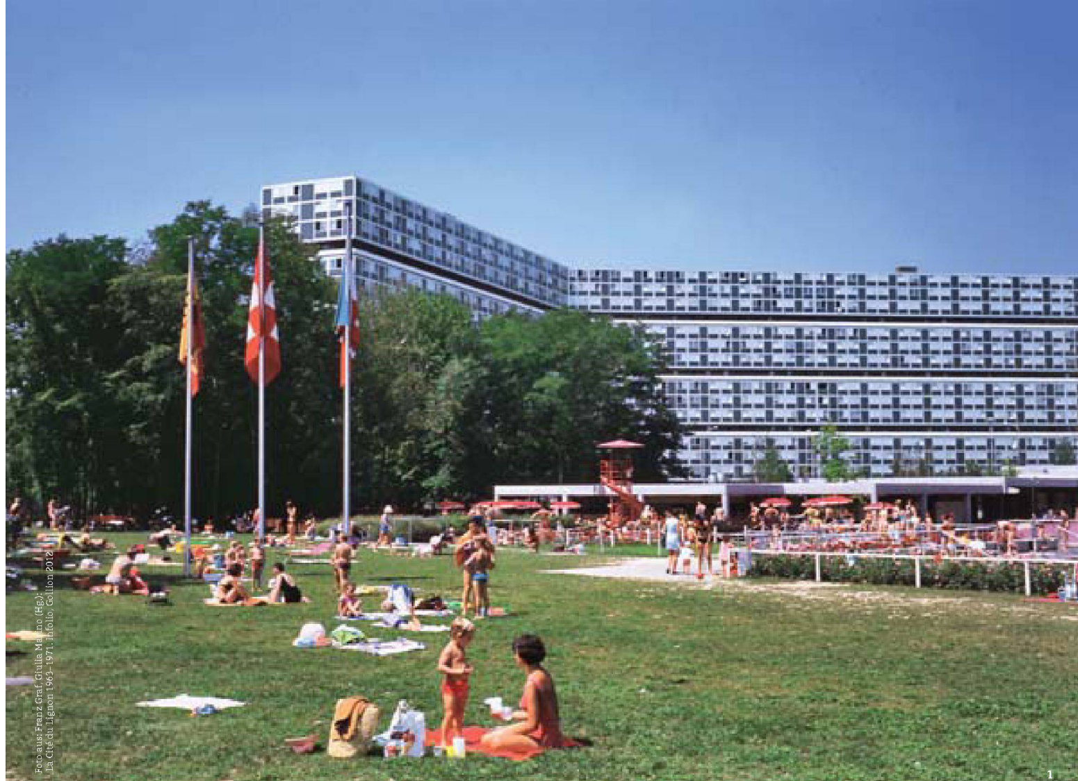
Fotograf: Franz Graf, Giulia Marino (Rg.), La Cité du Lignon 1963–1971, Infolio, Gollion 2012

1 Siedlung Le Lignon in Vernier bei Genf in den 1970er-Jahren | La Cité du Lignon à Vernier près de Genève dans les années 1970 | Insediamento di «Le Lignon», a Vernier nei pressi di Ginevra, anni Settanta