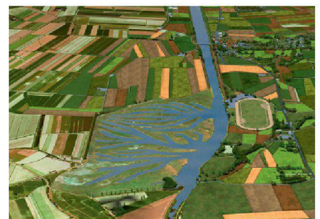
02 Eine neue Schleuse reguliert den Wasserstand im Couesnon und ist zugleich Teil der Inszenierung der Bucht des Mont Saint-Michel. 03 Ein ehemals verlandeter Altarm des Couesnon fungiert wieder als Wasserreservoir; bei Ebbe hilft das gespeicherte Wasser, Sedimente aus der Bucht hinaus ins Meer zu spülen.