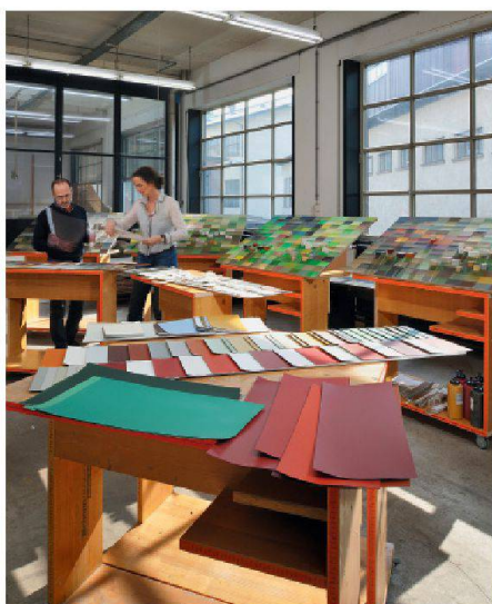
Farbkultur im Thurgau.

Viele ländliche Regionen können auf eine reiche Farbkultur zurückschauen, die massgeblich zur Identität dieses Lebensraums beiträgt. Heute befinden sich diese Regionen oft im Umbruch. Ein Team vom «Haus der Farbe» ging im Auftrag der Denkmalpflege Thurgau der Frage nach, wie eine regionale Farbkultur erfasst, gepflegt und gestaltet werden kann.