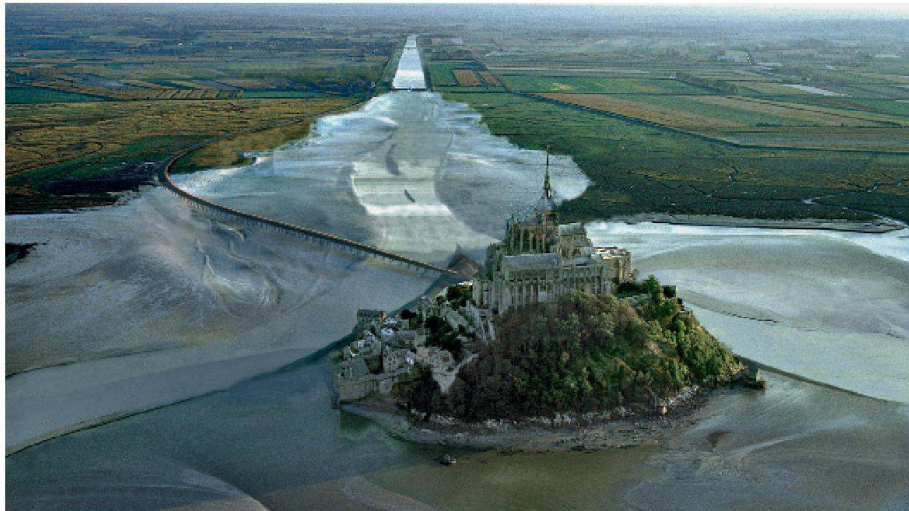
01 Das Ziel für 2025: Die Visualisierung zeigt den künftig erhofften Küstenverlauf am Mont Saint-Michel bei Flut. (Visualisierungen: Imagences / MG Design)

Aus dem Mont Saint-Michel an Frankreichs Ärmelkanalküste soll bis 2025 wieder eine echte Insel werden. Ursprünglich sieben Kilometer vom Land entfernt, drohte die Klosterinsel bis 2040 vollkommen von Salzwiesen umgeben zu sein. Das langfristige Ziel der Bauarbeiten: das Watt rund um den Berg durchschnittlich 70 cm absenken.