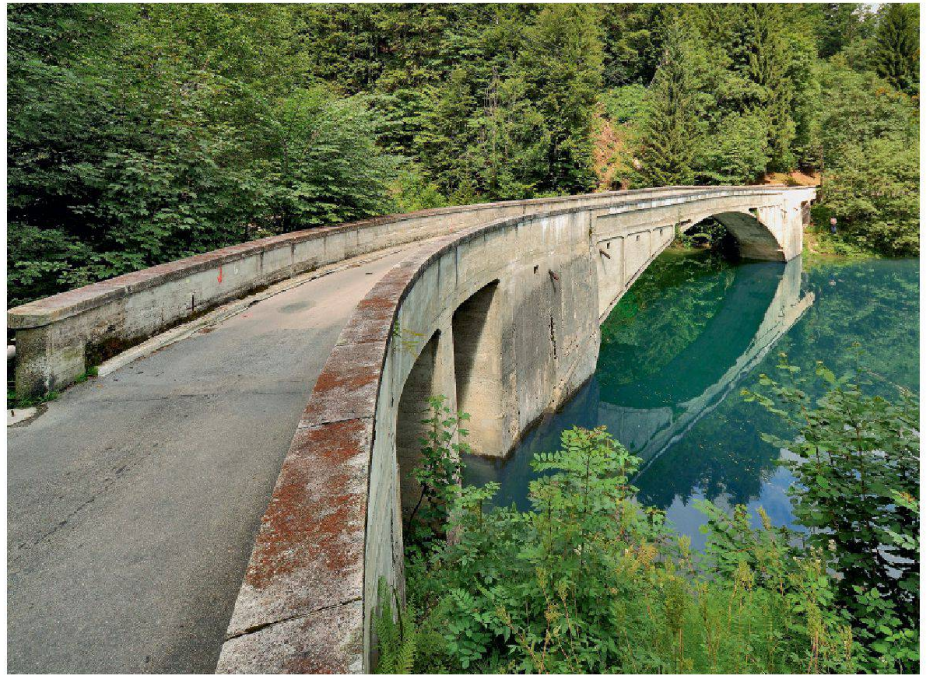
Die Schrähbachbrücke am Wägitalersee wurde zum Abbruch verurteilt.

(te/dpa) Der Bezirksrat stützte sich auf einen Beschluss der Schwyzer Regierung, der die Schrähbachbrücke nicht ins kantonale Inventar geschützter und schützenswerter Bauten aufnehmen wollte. Die Brücke besitze laut Regierung zwar einen bau- und kunsthistorischen Wert, der aber für ein Abbruchverbot nicht ausreichte: Die bestehende Brücke mit für heutige Verhältnisse ungenügender Traglast (aktuell: 18-t-Verkehr) sei nur mit grossem finanziellem Aufwand sanierbar. Auch bei einer Instandsetzung würden ursprüngliche Elemente der Maillart-Brücke zerstört.