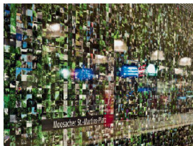
München: «Moosacher St.-Martins-Platz».