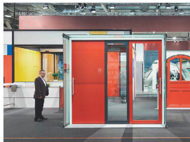
Im Mondrian-Look: der Stand von Feuerschutz Team.

Aktuelle Referenzbauten wie der Seniorenpark Weissenau Unterseen oder die Ecole Internationale de Genève waren am Messestand von Feuerschutz Team die beherrschenden Themen. Darüber hinaus zeigte das Unternehmen Drehflügel- und Schiebetüren gemäss EI30-Brandschutzanforderung und mit bis zu 3450 mm Türblatthöhe sowie verglaste EI30-Brandschutz-Pendeltüren mit Seitenteilen als Pfostenriegelkonstruktion. • www.feuerschutzteam.ch