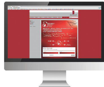
Vereinfacht die Ausschreibung: das Devis-Tool von Brunex.

Brunex lancierte auf der Messe den Devis-Tool-Produktkonfigurator für Architekten und Planer. Damit können die Türen aus dem gesamten Brunex-Sortiment vollständig gemäss NPK 622 konfiguriert werden. Das Tool importiert die Ausschreibungstexte über die Schnittstelle SIA 451 automatisch in die richtige NPK-Position; das vereinfacht die Ausschreibung wesentlich. Dank der Zusammenarbeit mit der Schweizerischen Zentralstelle für Baurationalisierung CRB ist das Devis-Tool Bestandteil der Produktdatenplattform PRD. Deren Nutzer können so direkt auf die Brunex-Produkte zugreifen und sie mit dem Tool planungsgemäss konfigurieren. • www.brunex.ch