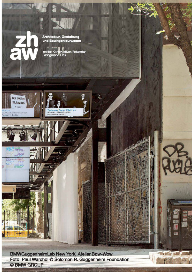
BMW Guggenheim Lab New York, Atelier Bow-Wow

Mittwoch, 26. März 2014 | ZHAW Winterthur