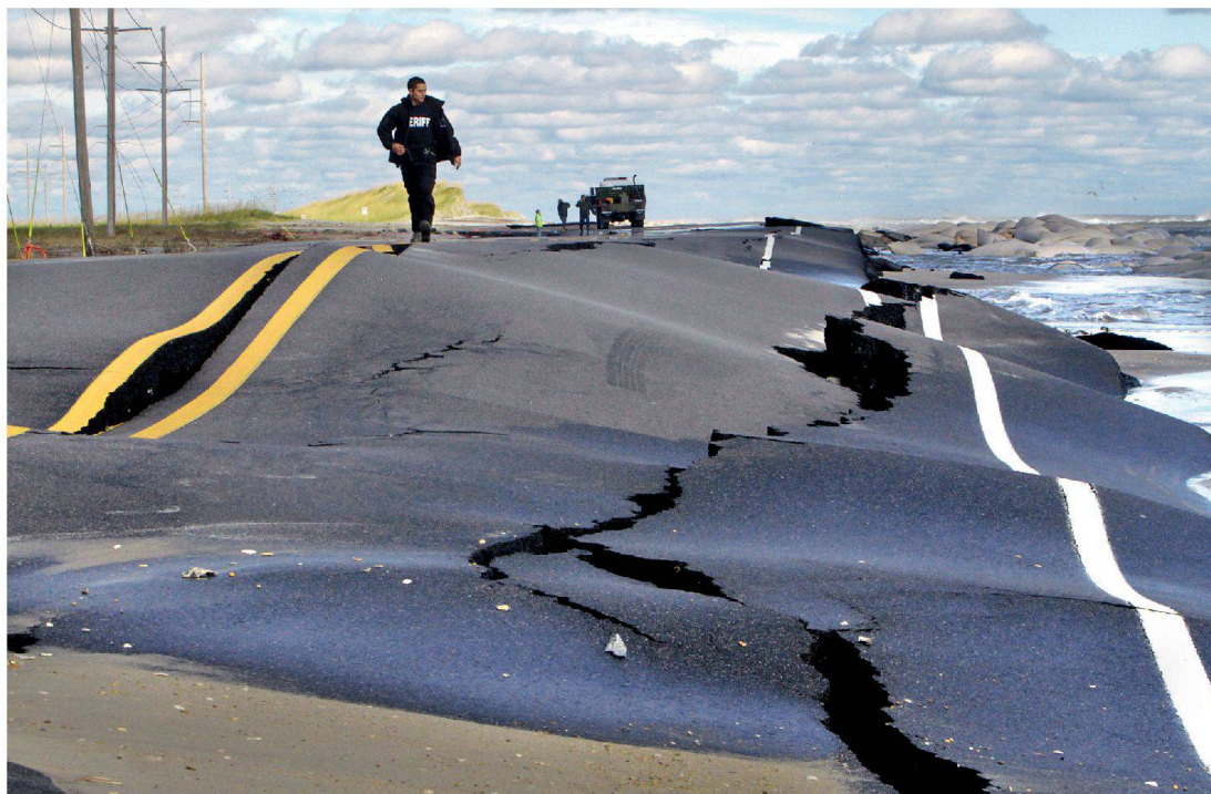
Um sich gegen künftige Naturgewalten besser zu wappnen, wird New York unter anderem in die Renaturierung der Küsten investieren, damit sie als Puffer gegen Flutwellen wirken können.

Bresch: Wir haben die Stadt New York und ihre Risikoexposition nach dem Hurrikan «Sandy» im Herbst 2012 untersucht. Das haben wir schon vor Jahren vorgeschlagen, aber es hat dieses Ereignis gebraucht, damit die Stadt bereit war, in eine solche Studie zu investieren. Wir haben festgestellt, dass die Risiken für New York massiv zunehmen. Grosser Anpassungsbedarf besteht beispielsweise bei der Infrastruktur, die zu einem beachtlichen Teil aus dem frühen letzten Jahrhundert stammt. Wenn man die Empfindlichkeit gegenüber solchen Ereignissen reduzieren will, muss man in das Gefüge dieser Stadt eingreifen und sich überlegen, wie man die vordersten, wassernahen Gebiete entwickelt. Ein grosser Teil der Stromversorgung befindet sich dort im Untergrund. Es wäre sinnvoll, die elektrischen Anlagen in den ersten Stock zu verlegen, doch würde dies Kosten nach sich ziehen. Und Investoren denken leider oft sehr kurzfristig, mitunter lernen sie aber schnell.