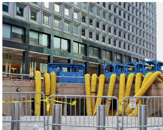
Der Hurrikan «Sandy» deckte die Defizite in New York schonungslos auf. Insbesondere bei der veralteten Infrastruktur besteht Anpassungsbedarf.

Hohmann: Die Fallstudie Aargau hat sehr schön aufgezeigt, dass man die Risiken und Chancen in den verschiedenen Sektoren beziffern und mitein-