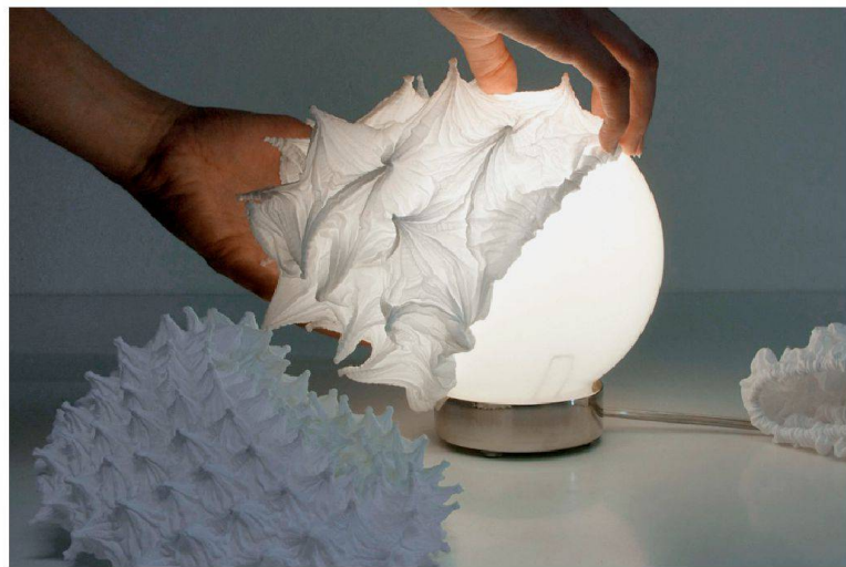
Shibori-Stoffe als Überzug für Leuchten: Das japanisch-deutsche Label Suzusan adaptiert die jahrhundertealte Technik für neue Nutzungen.