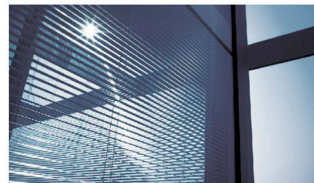
Sonnenschutz der Zukunft: ins Isolierglas integrierte Jalousie.