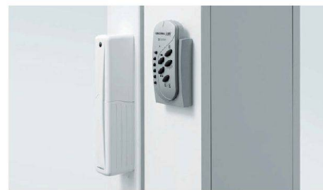
Motorantrieb für automatisches Öffnen und Schliessen von Hebeschiebetüren.

Für weitere Ausführungen jetzt Unterlagen bestellen und CAD-Vorlagen für Ihre Planung downloaden unter www.egokiefer.ch .