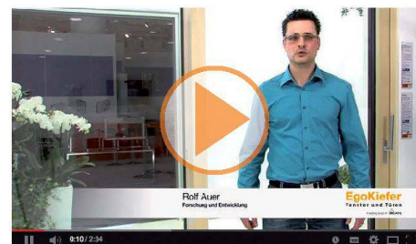
EgoKiefer Holz/Aluminium Hebeschiebetüre XL®2020 und EgoKiefer Kunststoff/Aluminium Hebeschiebetüre XL®2020.

Zu den Produktvideos: www.egokiefer.ch/innovationen