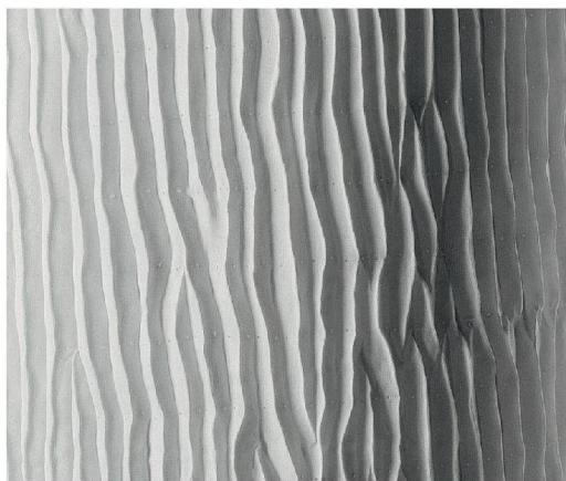
Mokume Shibori entsteht, indem man den Stoff heftet und dann in Falten zusammenzieht.

der Konturen kleine Löcher in das Papier. Diese Schablone wird nun auf den Stoff gelegt und mit Farbe bestrichen, sodass das Muster auf den Stoff gelangt. Die Konturen zeigen an, wo der Stoff in einem zweiten Schritt zusammengeheftet wird. Die unzähligen Varianten des Shibori lassen sich grob in vier Gruppen einteilen: Zusammenbinden, Heften, Falten und Wickeln (nachfol-