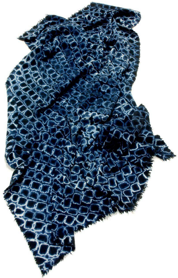
Schal mit Muster in hitta miura («in Schlingen zusammenbinden»).

Nach Japan gelangte das Verfahren etwa im 8. Jahrhundert aus China. Baumwoll-, Hanf- und Seidenstoffe für Kimonos wurden auf diese Weise veredelt. Im