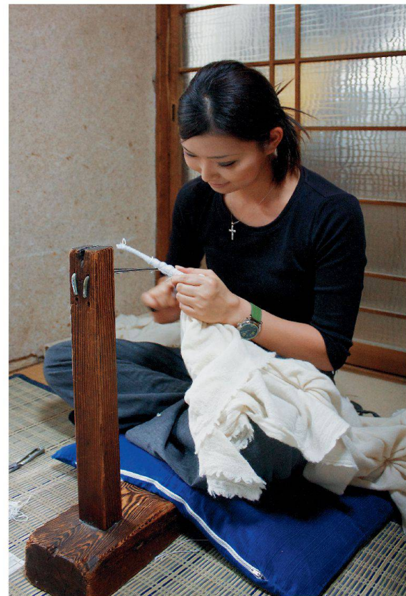
Shibori mithilfe des Holzständers tesuji dai – im 17. und im 21. Jahrhundert.