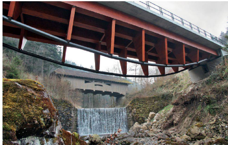
Die denkmalgeschützte Holzbrücke und die neue Brücke von 2012 nehmen mit ihren beiden Bögen Bezug zu einander: Der neue Brückenträger mit Unterspannung ist das statische Spiegelbild des Druckbogens der alten Holzbrücke.