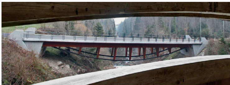
Die Widerlagerbauwerke erscheinen eigenständig, weil sie gestockt und mit einem seitlichen Kragen versehen sind, der sich ausgehend von den Leitmauern dreieckförmig nach unten verjüngt.

trägt der neue Brückenträger mit Unterspannung die Lasten über eine Stabkette auf Zug ab (Abb. oben). Die wesentlichen Konstruktionselemente der Aufständigung und des Versteifungsträgers der neuen Brücke sind wie bei der historischen Brücke in Holz gehalten, womit die beiden Bauwerke über die reine Funktionalität hinaus zu einem Ensemble geworden sind.