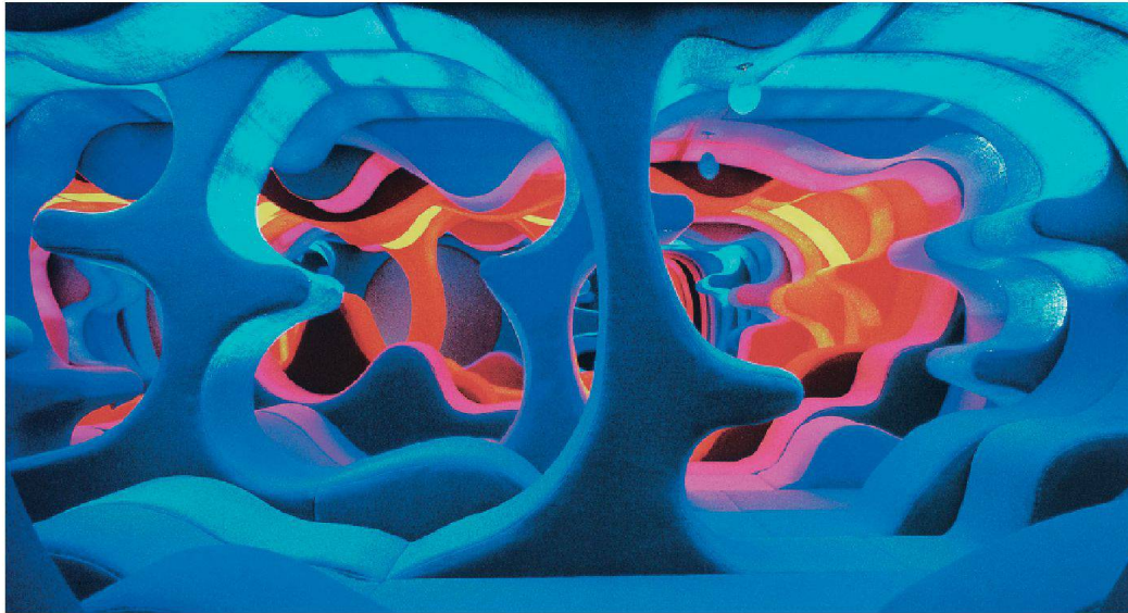
Zukunftsforschung, Utopie und Vision im Design stehen derzeit im Fokus des Vitra Design Museums: Die Installation «Phantasy Landscape» gilt als Herzstück der Wohnausstellung «Visiona 2».

S oll man stehen, sich setzen oder gar liegen? Oder vielleicht doch besser knien? Das fragen sich die Besucher beim Betreten der Wohnlandschaft in leuchtenden Blau- und Rottönen, die ein wenig an eine Kinderspielandschaft erinnert. Alles ist möglich, denn der Boden, die Wände und Decken sind mit einem Wollmischgewebe überzogen, ihre organischen Formen fliessen Übergangslos ineinander. Die begehbare Installation 1 namens «Phantasy Landscape» ist der Mittelpunkt einer Ausstellung im Vitra Design Museum, das sich im Frühjahr und Sommer 2014 den Themen Zukunftsforschung, Utopie und Vision im Design widmet. Mit einer Grösse von 6×8 m ist die Installation etwa halb so gross wie das Original, das der dänische Designer Verner Panton 1970 für die dritte Ausgabe der Wohnausstellung «Visiona» in Köln entworfen hatte. Die «Visiona» fand in den Jahren 1968 bis 1972 jeweils während der