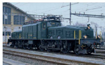
Krokodil Be 6/8 III 13302, Baujahr 1926.

Der Verein «Industriegeschichte(n)» hat sich zum Ziel gesetzt, ein Krokodil zurück nach Oerlikon zu bringen und in unmittelbarer Nähe zum Ort