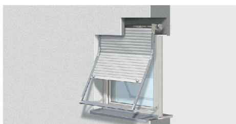
WAREMA Schacht-Rollladen: Einfache Montage bei außenliegenden Schächten

Mehr SonnenLichtManagement online: www.warema.ch/qualitaet