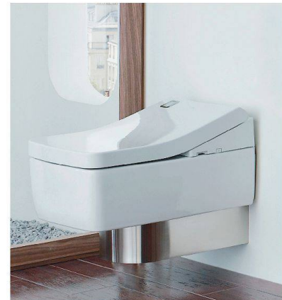
Toilette «Washlet» von Toto.