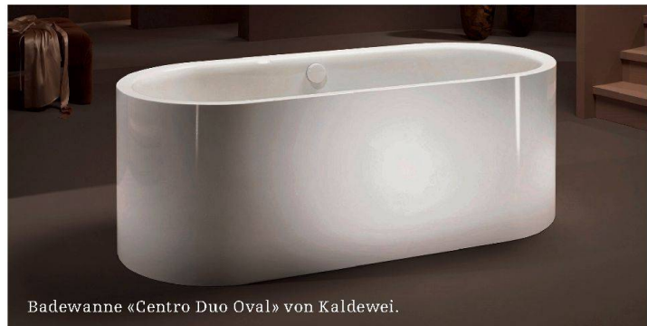
Badewanne «Centro Duo Oval» von Kaldewei.