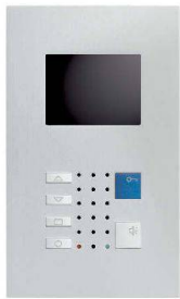
VTC40 / Alu

Video-Innensprechstellen aus edlem Metall – bilden einen Blickfang im gehobenen Innenausbau. Als Klein-ausführung im Schalterformat (Gr. 1+1) oder mit grösserem Farbdisplay für erweiterte Videoüberwachung. Die Frontplatten aus veredeltem Aluminium bestechen durch das klare Design und bleiben zeitlos wertbeständig. Die neueste Technik ermöglicht überall einen schlanken Einbau.