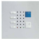
TC40 / Alu