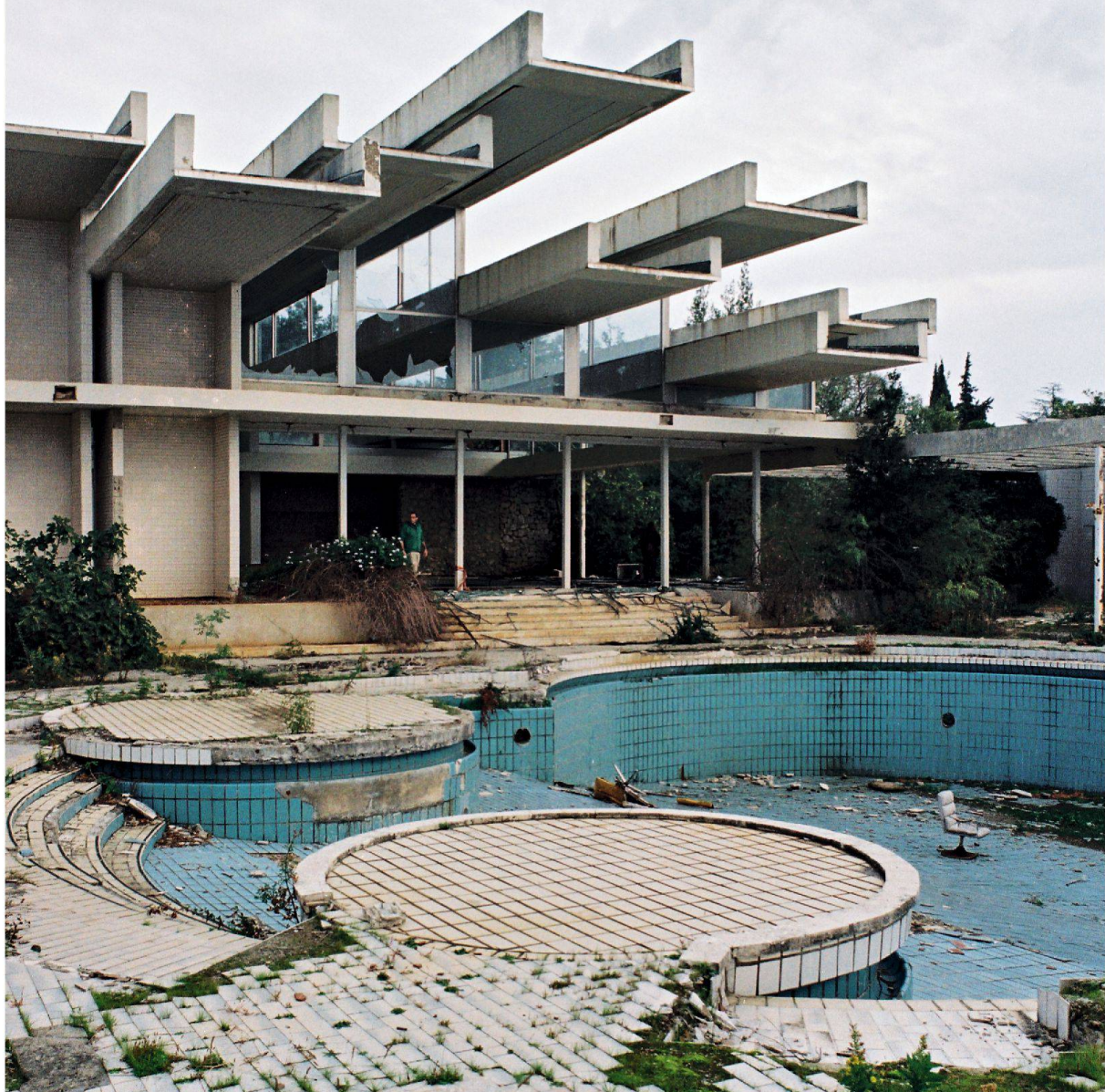
Das Ferienresort Haludovo auf der Insel Krk von Boris Magaš (1972). Das Joint Venture zwischen Penthouse Magazin und Volksrepublik liegt heute in Trümmern und wird langsam ausgeschlachtet.