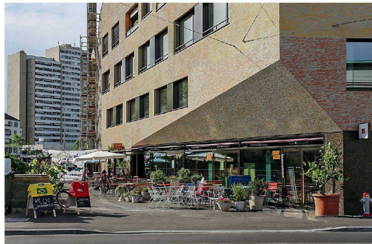
Geschäfte und Gastronomie beleben das Erdgeschoss der Überbauung Kalkbreite.