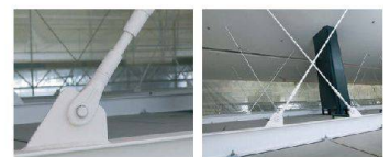
Aufhängung Baldachin über Check-In

Die Produkte von HALFEN bedeuten Sicherheit, Qualität und Schutz – für Sie und Ihr Unternehmen.