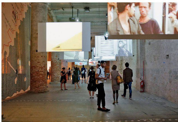
In den Corderie werden Filme gezeigt, deren Drehorte mit den Stationen der Ausstellung übereinstimmen.

So widmen die Kuratoren Ila Beka und Louise Lemoine eine Videoinstallation dem Ort La Maddalena mit den Koordinaten 41° 12' 53" N/09° 24' 21" E. Der G8-Gipfel 2009 sollte plangemäss auf dieser Insel vor Sardinien stattfinden, dafür wurde ein Kongresszentrum gebaut. Doch am 23. April 2009 gab der damalige Ministerpräsident Silvio Berlusconi bekannt, dass das Treffen nach L'Aquila verlegt würde. Er wollte damit die Aufmerksamkeit der Weltöffentlichkeit auf die vom Erdbeben am 6. April 2009 zerstörte Abruzzen-Region lenken und den dortigen Bewohnern ein Zeichen der Hoffnung geben. In einem Film erzählt der Architekt des Kongresszentrums von La Maddalena, Stefano Boeri, von seiner persönlichen Beziehung zum