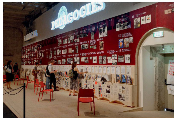
«Radical Pedagogies» zeigt eine Reihe von pädagogischen Experimenten, die den architektonischen Diskurs formten.