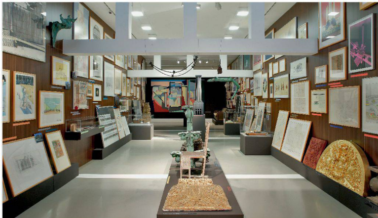
Ein Blick in die Ausstellung im DAM.