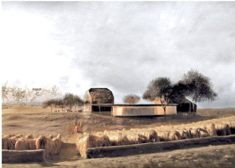
Modellbild des Projekts auf der Insel Ufenau. In seiner Ausdruckskraft erinnert es an Gemälde von William Turner oder Caspar David Friedrich.

Und so blickt man dem begnadeten und willensstarken Entwerfer gleichsam über die Schulter und ganz tief in Kopf, Herz und Hand. Atmosphärisch dichte Bilder und Zeichnungen begleiten Zumthors