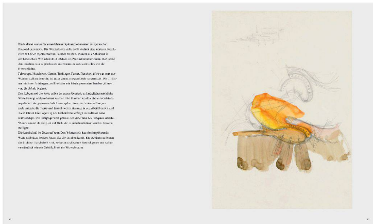
Der Text aus der Feder von Peter Zumthor, die atmosphärisch dichte Zusammenstellung von Dokumenten aus dem Architekturbüro sowie der grafische und suggestiv erzählerische Weissraum sind die Zutaten der eindrücklichen Monografie.