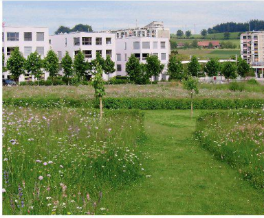
Blumenwiese im Brännengut.

Ökologiefonds profitieren zu können. Als Grundlage für das Ökologiekonzept wurden vor der Überbauung eine Bestandsaufnahme der bestehenden Naturwerte gemacht, ihre ökologische Bedeutung und ihr finanzieller Wert festgehalten. Zum zweiten wurden mögliche Ersatz-