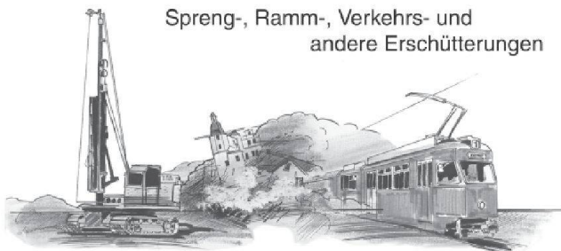
Spreng-, Ramm-, Verkehrs- und andere Erschütterungen

Die Ausschreibungsunterlagen für die Präqualifikation können ab dem 12. September 2014 online auf folgender Homepage bezogen werden: http://www.metron.ch/Datentransfer.html .