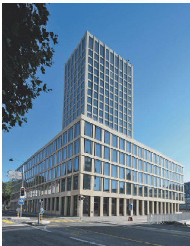
FH St. Gallen (Giuliani Hönger Architekten) mit Kastenfenstern von Krapf.