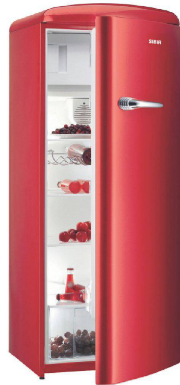
Modell «Oldtimer OT 272» von Sibir.