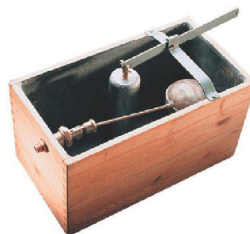
Geberit-Holzspülkasten um 1905.