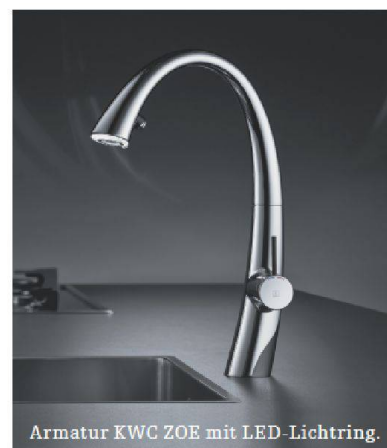
Armatur KWC ZOE mit LED-Lichtring.