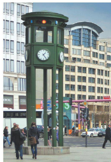
Ampelturm am Potsdamer Platz, Berlin.

Im Jahr 1914 ging die erste elektrische Ampel in Cleveland, Ohio, in Betrieb – ein Meilenstein für die Verkehrssteuerung. Zehn Jahre später folgte Siemens am Potsdamer Platz in Berlin, damals der verkehrsreichste Platz Europas, mit dem berühmten fünfeckigen Ampelturm. In der Schweiz ist heute rund die Hälfte aller Lichtsignale mit Steuerungen von Siemens ausgerüstet. Seit 2010 stellt Siemens ausschliesslich Signalgeber mit LEDs her. Sie verbrauchen bis zu 90% weniger Energie und haben eine längere Lebenserwartung: Statt zweimal jährlich, wie herkömmliche Glühlampen, müssen sie nur etwa alle zehn Jahre ausgetauscht werden. Ausserdem sind LED-Ampeln bei direkter Sonneneinstrahlung sowie von der Seite besser sichtbar. Die Ampelschaltung kann auch von Umweltdaten beeinflusst werden: In Potsdam sammelt ein Verkehrsmanagementsystem Daten zu Fahrzeugaufkommen und Wetter, Windverhältnissen, Temperatur und zur örtlichen Bebauung und berechnet daraus ein Schadstoffprofil einzelner Strassenabschnitte. Dort, wo die Feinstaub- und NO 2 -Konzentration zu hoch ist, schaltet das System grüne Wellen, um den Verkehrsfluss zu beschleunigen, oder es verkürzt die Grün-