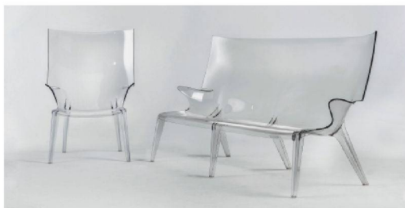
«Uncle Jim» und «Uncle Jack».