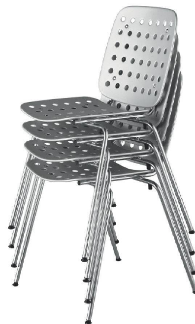
Gestapelte Coray-Stühle, die kleinen Brüder des Landi-Stuhls, Kollektion Seledue.