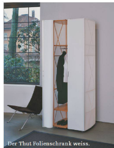
Der Thut Folienschrank weiss.

Er wiegt gerade einmal 26 kg, der Folienschrank von Thut. Bis heute gehört er zu den Bestsellern aus der Thut'schen Manufaktur, in der Schweiz wie international. Zum 20-Jahr-Jubiläum ist er in neuen Farben erhältlich: Drei Blautöne (Navy-, Hell- und Mediumblau) sowie Braun und Orange stehen nun zur Auswahl. Das Designstück eignet sich sowohl für den Wohn- als auch für den Schlafbereich. Alle Holzteile sind aus Naturbuche, die Kantenschutzprofile aus farblos eloxiertem Aluminium hergestellt, und die Bespannung besteht aus einem Segeltuch (Dacron). Den Schrank gibt es in zwei Höhen und zwei Tiefen; mit Tabellen, Kleiderstangen, Garderobe-Auszügen und Drahtkörben lässt er sich individuell ausstatten. •