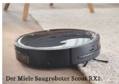
Der Miele Saugroboter Scout RX1.

Der kleine Handwerksbetrieb Miele begann im Jahr 1899 mit dem Verkauf von Milchzentrifugen und Buttermaschinen. Auf dieser technischen Grundlage wurde 1900 die erste Waschmaschine entwickelt. Weitere Innovationen folgten: die erste Geschirrspülmaschine Europas im Jahr 1929, die Schontrummel mit Wabeneffekt für die sanfte Wäscheschonung, der Combi-Dampfgarer. Neu aus dem Haus Miele ist der Saugroboter Scout RX, der sich