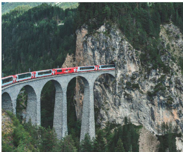
Glacier-Express auf dem Landwasserviadukt bei Filisur.