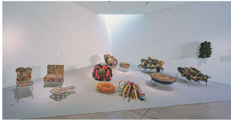
Teilansicht der Ausstellung «Antibodies – The Works of Fernando & Humberto Campana 1989–2009» im Jahr 2009.