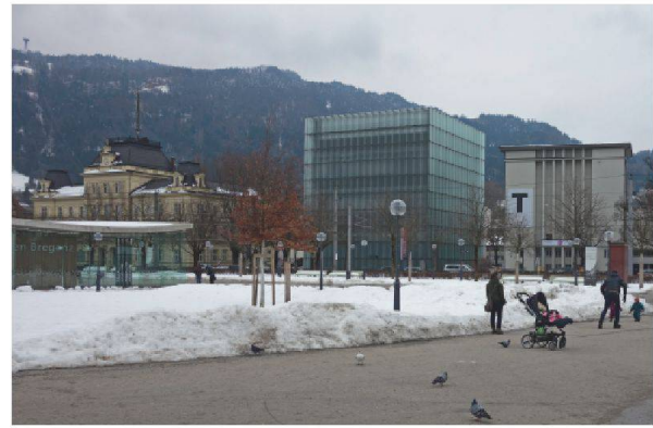
Die Fassade regt zu Vermutungen an, erschliesst sich aber nicht allein mithilfe des bisherigen Erfahrungsschatzes.

in der Schweiz immer wieder polarisiert, wird in Bregenz von jedermann geliebt. Der hellgraue, samtig schimmernde Beton ist der ausgestellten Kunst im sanften Oberlicht der Glasdecken ein intensivierender Hintergrund. Für jede Ausstellung dürfen neue Löcher in die Wände gebohrt werden. Dieses erlaubte, sogar geplante sichtbare Altern ist eher ungewöhnlich für ein Museum mit Anspruch auf Dauerhaftigkeit. Künstler und Kuratoren können hier unmittelbar mit der Konstruktion arbeiten. Viele Werke sind minutiös den Gegebenheiten in den Ausstellungssälen angepasst.