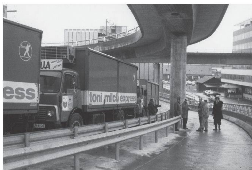
Nachdem die Rampe erstellt war, führte die Empa am 21. Januar 1975 Belastungsversuche durch.

Gebäudebewegungen infolge Schwind- und Kriechverkürzungen des Betons zu rechnen – vor allem auch aufgrund unterschiedlicher Temperaturen, denn das Kühlager sollte bis -30^{\circ}\text{C} heruntergekühlt werden können, während an Sommertagen durchaus mit Ausstemperaturen von bis zu +30^{\circ}\text{C} zu rechnen war.