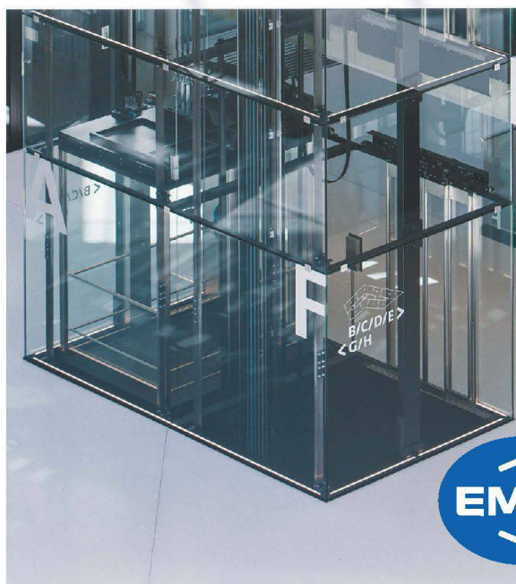
Businesspark – Ittigen Ateller 5 Architekten und Planer – Bern

Bauen Sie einen Lift, der so ist wie Sie – einzigartig.