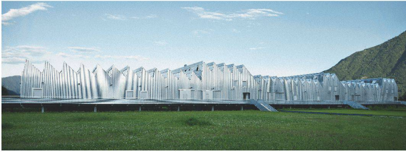
Der effiziente Einsatz des Stahls resultierte in einer Auszeichnung für das Berufsbildungszentrum in Gordola.