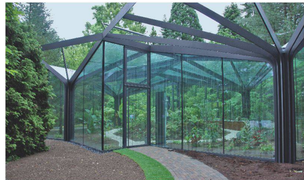
Die vier Anerkennungen: Swiss Convention Center in Lausanne, Haus Müller in Zürich, Panorambücke bei Sigriswil und der Botanische Garten in Grüningen.

können, während ein poetischer Umgang mit dem Stahl den Botanischen Garten in Grüningen ausmacht. Einige der ausgezeichneten Werke werden in den kommenden Ausgaben der Bautendokumentation «steeldoc» des Stahlbau Zentrums Schweiz (SZS) eingehend vorgestellt und erläutert.