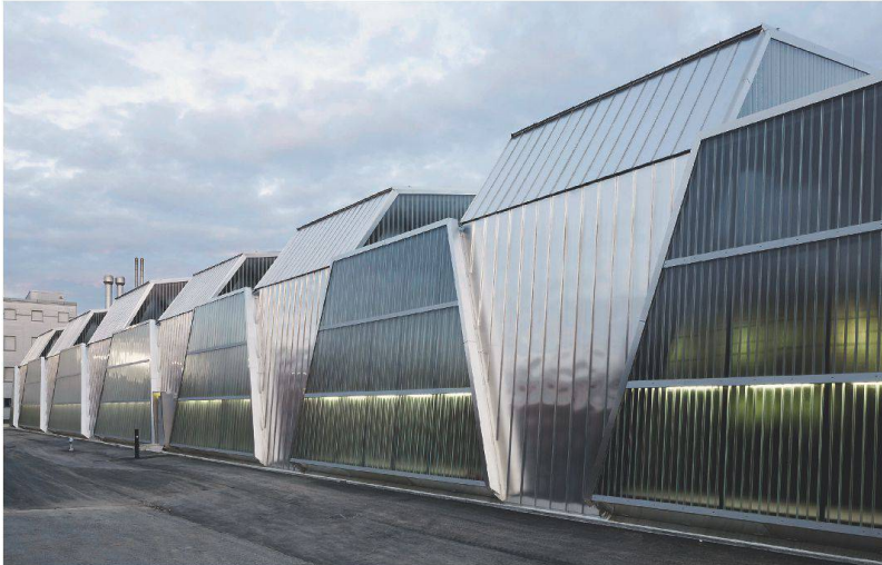
Die Planung des Tramdepots von Penzel Valier vereint Architektur und Tragwerk.