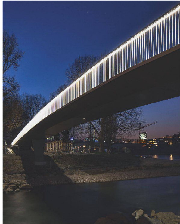
Zwei Infrastrukturbauten gehören zu den Preisträgern: die präzise eingepasste Verbindung der Schulanlagen Plessur und Halde in Chur und die filigran konstruierte Brücke in Birsfelden .

Insgesamt 36 Projekte wurden für den diesjährigen Prix Acier eingereicht. Die rege Beteiligung am Stahlbaupreis ist ein Zeichen für die zunehmende Bekanntheit und Akzeptanz des Preises in der ganzen Schweiz. Erfreulich ist auch die gestalterische Vielfalt der eingereichten Arbeiten, an denen sich die unterschiedliche Haltung bezüglich der Formgebung in der Romandie, dem Tessin und der Deutschschweiz zeigt.