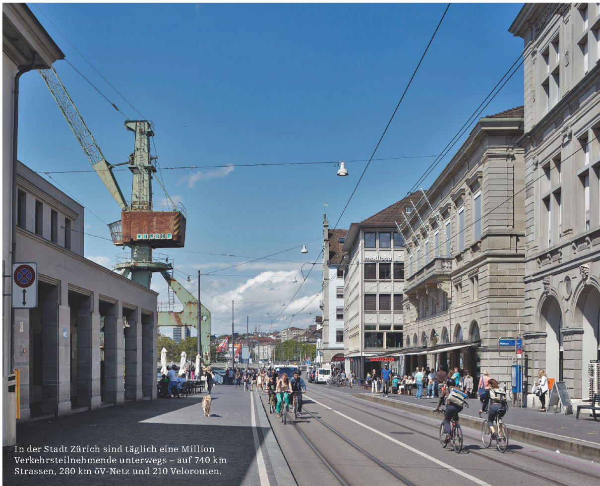
In der Stadt Zürich sind täglich eine Million Verkehrsteilnehmende unterwegs – auf 740 km Strassen, 280 km öV-Netz und 210 Velorouten.

G emessen an anderen Schweizer Städten und erst recht im europäischen oder globalen Vergleich kann man sich in Zürich hervorragend fortbewegen. Trotzdem hört man in der Limmatstadt Klagen auf hohem Niveau: Die öffentlichen Verkehrsmittel seien in den Spitzenzeiten zu voll, die Velowege unterbrochen, der motorisierte Verkehr stauete sich zu oft, in der Innenstadt gebe es zu wenige