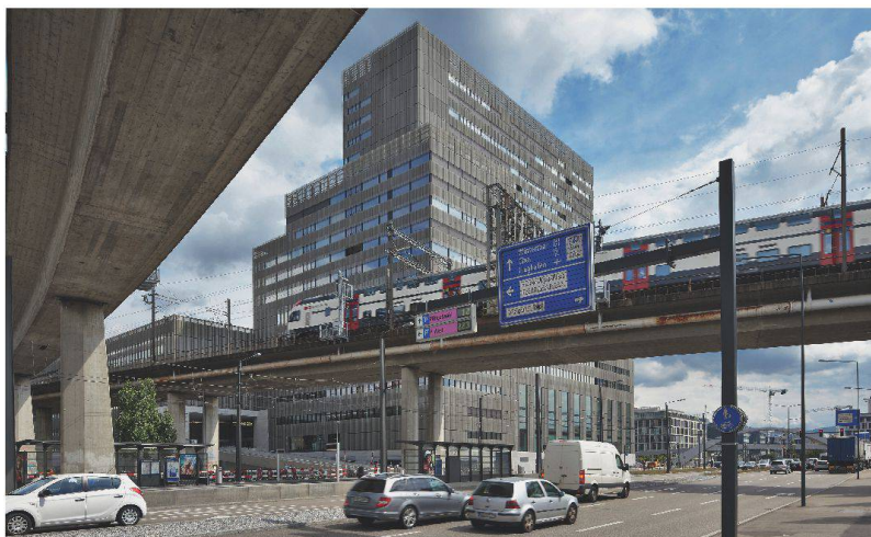
Ein nachfragegerechter Ausbau der Schienen- und Strasseninfrastruktur ist in der Stadt Zürich nicht möglich – aus verschiedenen Gründen: fehlende Finanzmittel, beschränkter Raum, widersprechende Interessen und langwierige Realisierungsfristen.

Das sternförmig angeordnete Tramnetz wurde lang nicht angetastet. Was heute die Busse leisten, sollen künftig auch Tramlinien übernehmen: Ringe und Tangentiale sollen die City entlasten. Mit der Durchmesserlinie der S-Bahn werden die Fahrgastzahlen weiter steigen. Wer also nicht unbedingt in die Innenstadt muss, soll diese umgehen können. «Wichtig ist uns, die Polyzentren zu stärken und das Tramnetz dezentral anzuordnen», sagt Fellmann. «Hierzu gehört auch, die Tramlinie 8 über die Hardbrücke zu führen. Eigentlich nur eine kleine Netzergänzung, jedoch mit grosser Wirkung, weil die tangentielle Verbindung über die SBB-Gleise bis heute im Tramnetz fehlt.» Der letzte grosse Tramausbau war die Linie 4 in Zürich-West, die im Dezember 2011 eröffnet wurde. Obwohl man sie bei Baubeginn noch nicht gebraucht hätte, war man überzeugt, dass sie künftig gebraucht werden würde. Als Glücksfall entpuppte sich die Fussball-Europameisterschaft 2008 und das geplante Stadion – auch wenn