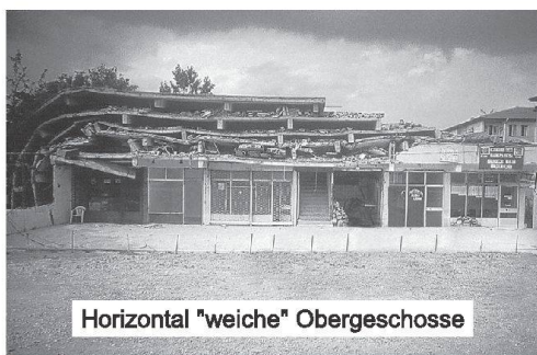
Horizontal "weiche" Obergeschoss