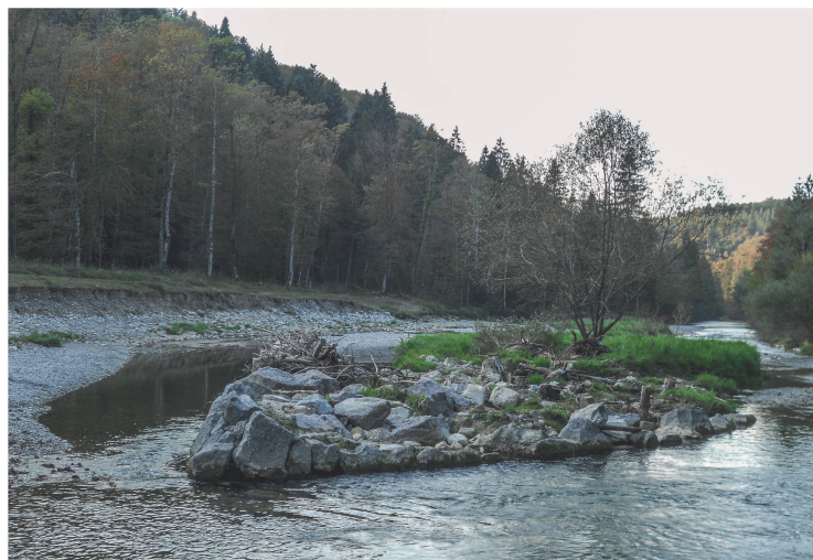
Revitalisierter Abschnitt der Töss im Linsental bei Winterthur. Solche Flussaufweitungen waren nicht überall möglich, denn im Gebiet befinden sich sechs Trinkwassererfassungen der Stadt Winterthur.

Von der Öffentlichkeit bisher kaum wahrgenommen, schlummern jedoch weitere potenzielle Konflikte. So erhalten im Rahmen von Hochwasserschutzprojekten die Gewässer oft mehr Raum. Und der grosse Plan der Gewässerrevitalisierung sieht ebenfalls vor, den Flüssen wieder mehr Freiheit zu geben: In den nächsten 80 Jahren sollen 4000 km Fließstrecke von ihrem engen Korsett befreit werden. Wie eine Tagung des Eidgenössischen Wasserforschungsinstituts Eawag in Zusammenarbeit mit dem Schweizerischen Verein des Gas- und Wasserfachs