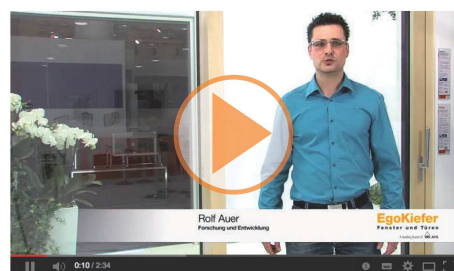
EgoKiefer Holz/Aluminium Hebeschiebetüre XL®2020 und EgoKiefer Kunststoff/Aluminium Hebeschiebetüre XL®2020.

Zu den Produktvideos: www.egokiefer.ch/innovationen