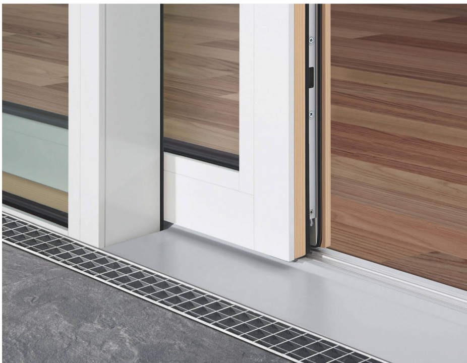
EgoKiefer Fenstertüren mit maximalem Lichteinfall und hindernisfreien Bodenschwellen.

Intelligente Fenstersysteme von EgoKiefer verbessern die Lebensqualität. Das automatische Öffnen und Schliessen von Hebeschiebetüren oder hindernisfreien Fenstertüren bieten Komfort und eine optimale Bedienbarkeit in allen Lebenslagen.