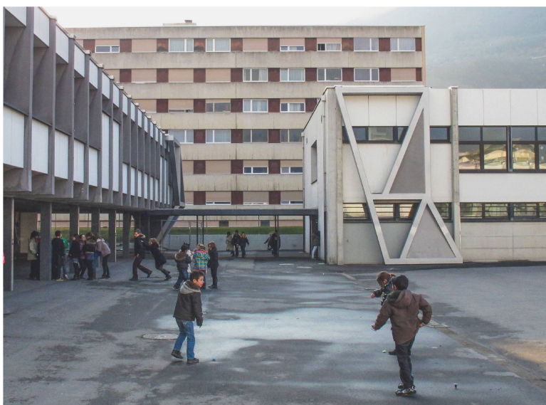
Der Gewinner des Architektur- und Ingenieurpreises erdbebensicheres Bauen 2012: Erdbebenertüchtigung des Collège de l'Europe in Monthey VS (vgl. Kasten unten). Tragkonstruktion: Kurmann & Cretton AG; Architektur: GayMenzel GmbH.

Website der Stiftung mit allen Ausschreibungsunterlagen und Publikationen: www.baudyn.ch