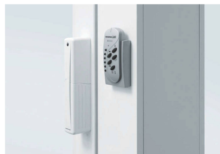
Motorantrieb für das Öffnen von Hebeschiebetüren.