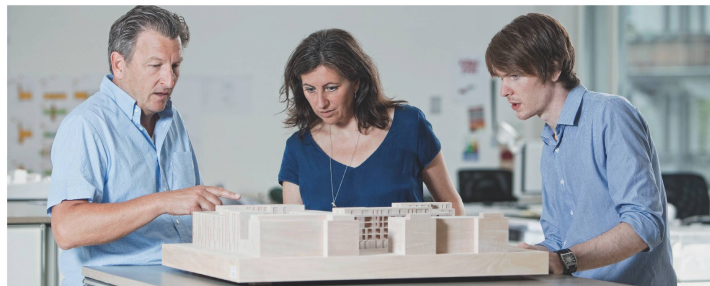
Nicht in allen SIA-Berufsgruppen ist der Frauenanteil so hoch wie bei den Architekten.

Auch in puncto Weiterbildung ist von Berufsverbänden, Politik und Bauwirtschaft echtes