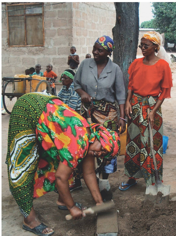
Frauen helfen bei der Anfertigung der Bausteine für die Toilettenhäuschen für den Stadtteil Chang'ombe in Tansania.