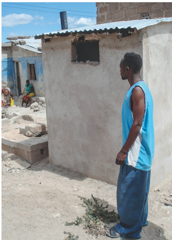
Tansania: Eines der neuen Toilettenhäuschen ist erstellt.

auch einkommensschwache Haushalte einzubeziehen, richtete eine lokale Kooperative ein Mikrofinanzierungsprogramm mit einer Laufzeit von 12 bis 24 Monaten ein. Ein Fonds und eine Anleitung für Wartung, Betrieb und Management der Infrastruktur gewährleisten die Nachhaltigkeit.