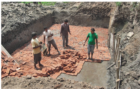
Der Boden der dezentralen Kläranlage besteht aus lokal hergestellten Backsteinen und wird danach mit Zement verputzt.