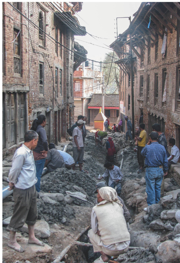
Bewohner der Stadt verlegen die simplifizierte Kanalisation, die zur dezentralen Kläranlage führt. Sie hat einen geringeren Rohrdurchmesser und transportiert nur Haushaltsabwässer und kein Meteorwasser.

Bewohner des Quartiers priorisierten die Probleme, sodass im nächsten Schritt in Experten- und öffentlichen Workshops mit Beteiligung von Sandec die beste technische Lösung gefunden werden konnte. Eine in Suaheli übersetzte Broschüre mit den verschiedenen technischen Alternativen für die Planung veranschaulichte die Möglichkeiten (vgl. Abb. links). Zudem unterstützten drei gebaute Pilot- und Demonstrationsanlagen mit unterschiedlicher Sanitärtechnologien die Bewohner bei der endgültigen Wahl.