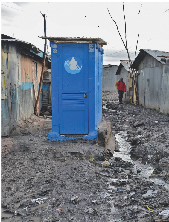
Der zweite, aufgrund der Erfahrungen in Uganda angepasste Toilettentyp wurde in den Slums in Nairobi getestet.

Frischwassertanks bei jedem Haus. Die Toilette funktioniert wie ein Möbelstück. Sie lässt sich in existierenden Toilettenhäusern aufstellen, da keine Anschlüsse an Strom, Wasser oder an die meist sowieso nicht vorhandene Kanalisation erforderlich sind. So können die Benutzer die Toilette auch mieten, statt sie zu kaufen.