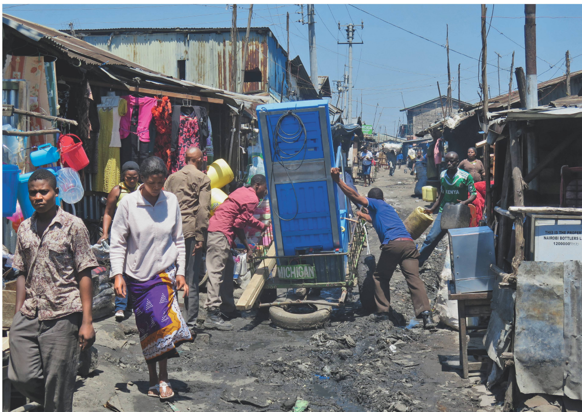
Ein zweites Modell der «Blue Diversion» wird 2014 in Nairobi mit einem Handkarren zum Testort gebracht.

teilzunehmen. Das Prinzip der Wertschöpfungskette wurde bereits 2008 im Kompendium der Sanitärsysteme und Technologien (vgl. S. 22) beschrieben. Das Projekt «Blue Diversion» lehnt sich an diese Vorgehensweise an, geht aber noch einen Schritt weiter, indem bereits im Designprozess auf die Benutzerfreundlichkeit geachtet wird. Das ist nicht selbstverständlich, denn über das Thema Toilettengang wird noch immer so gut wie nicht gesprochen, und Befragungen dazu sind eher selten. Der Ansatz stützt sich auf zwei Hauptprinzipien: Erstens werden Urin, Fäkalien und Wasser schon bei der Benutzung der Toilette getrennt. Das ermöglicht