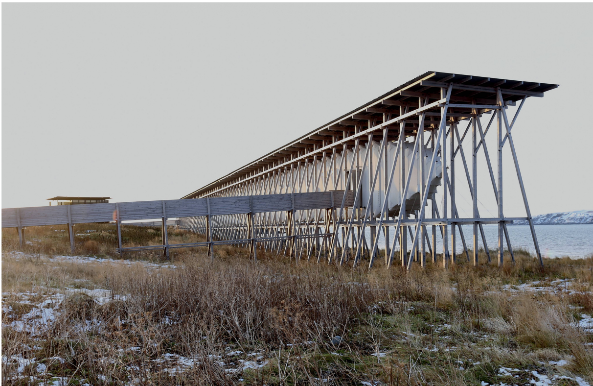
Das Steilneset-Mahnmal besteht aus einer lang gezogenen Holzkonstruktion (Peter Zumthor) und einem von Louise Bourgeois bespielten Glaspavillon (links im Hintergrund).