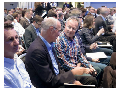
Besucher der Zürcher LHO-Veranstaltung.

der LHO; dass die Ordnung 112 neu als reine Verständigungsnorm definiert ist, die keinen Vertragscharakter hat, wurde ebenfalls einhellig begrüsst. •