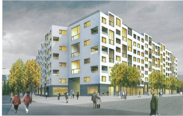
Das Siegerprojekt für die städtische Wohnsiedlung Hardturm in Zürich West von 2012.

Projekt: Alterswohnungen 60+ Köschenrüti, Zürich Bauherrschaft: Stiftung Alterswohnungen der Stadt Zürich Projektstand: realisiert 2014